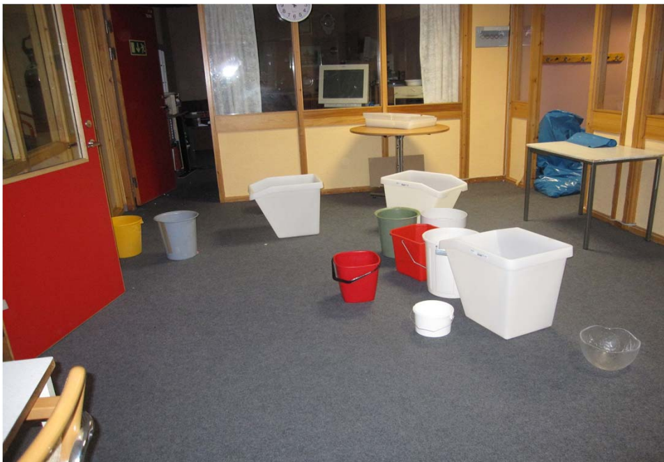
Monsun regn i lokalen under tävlingen.