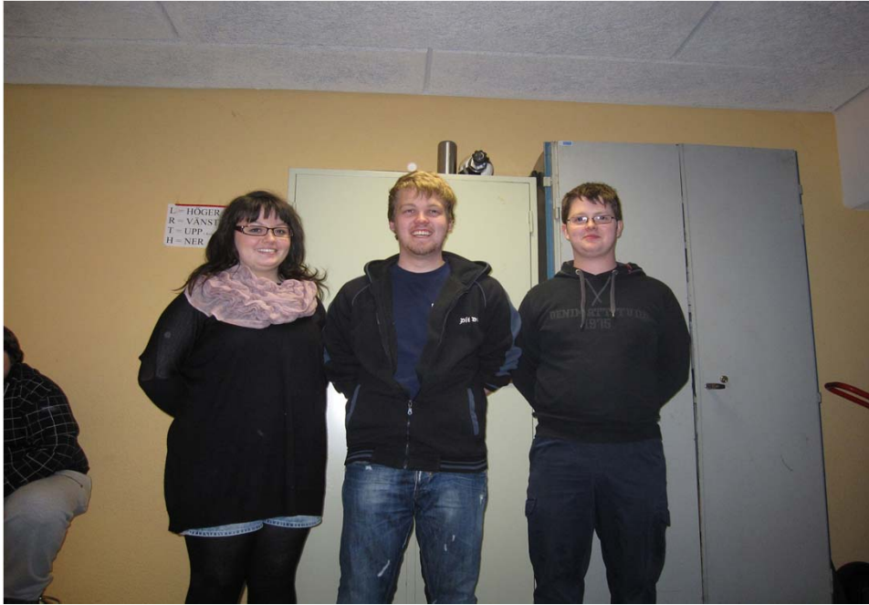
Förbundsmästare stående seniorer