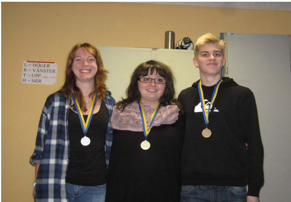
Förbundsmästare stående juniorer